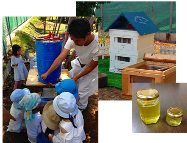
地域市民と一緒に採取活動