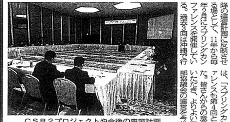
CSR2プロジェクトや今後の事業計画など、活発な意見交換が行われた。